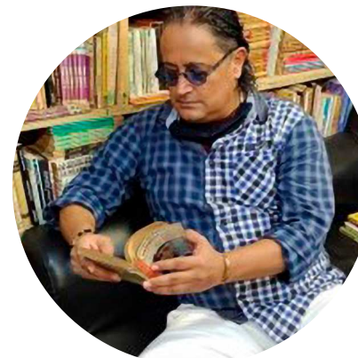
Martín Herminio Patiño Vargas